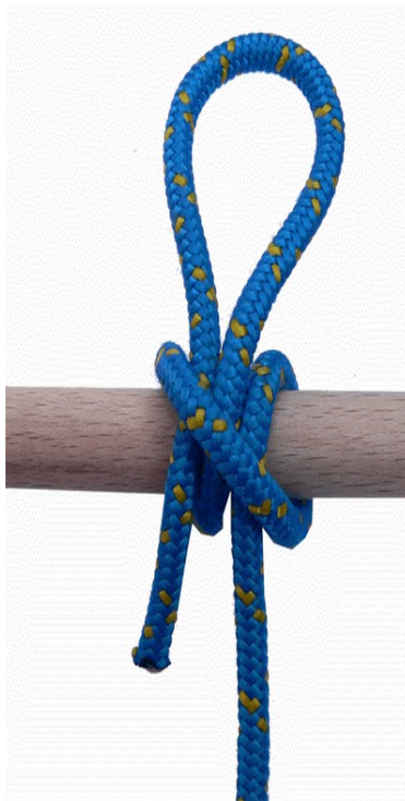
Webleinenstek auf Slip