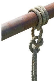
Rundtörn mit zwei halben Schlägen